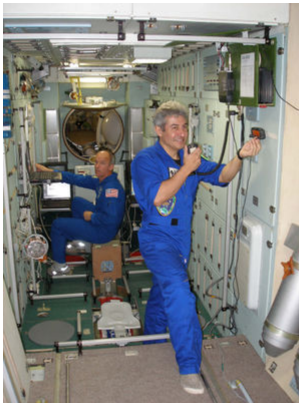
Foto de Marcos Pontes ( PY0AEB ), primeiro “passageiro” (ou caroneiro) da história espacial, apenas teve essa oportunidade devido a uma vaga comprada (por 20 milhões de dólares!) com dinheiro público numa viagem espacial da nave russa Soyuz TMA-8 até a Estação Espacial Internacional (ISS), realizada unicamente com fins eleitorais às vésperas das eleições de 2006. Foto divulgada pelo PT na propaganda eleitoral de 2006.